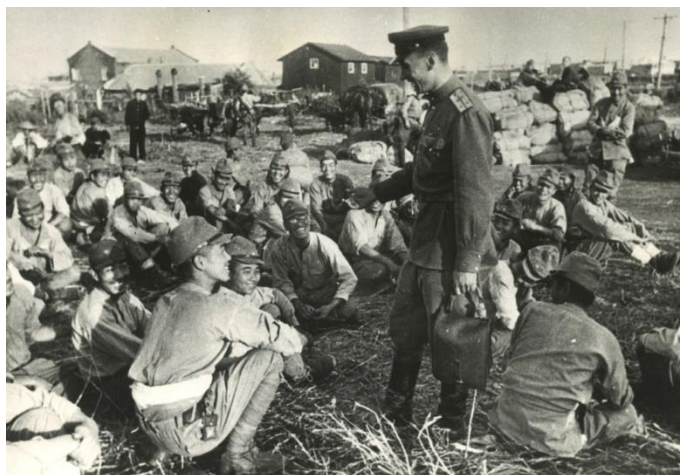
ソ連軍の満州侵攻後に将校と談笑する日本軍捕虜=1945（昭和20）年8月30日撮影