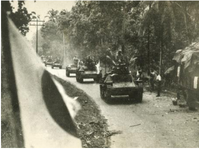
マレー侵攻で、シンガポール目指して進撃中の戦車第6連隊第1中隊の九五式戦車群＝撮影年代不明