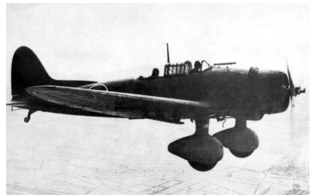
日本海軍の九九式艦上爆撃機＝1942（昭和17）年撮影