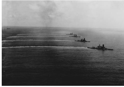
一斉回頭中の「金剛」型戦艦。手前より「金剛」「榛名」「霧島」「比叡」＝1942（昭和17）年4月1日撮影