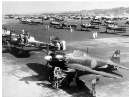
日本海軍の零式艦上戦闘機零戦（ゼロ戦）＝1944（昭和19）年撮影