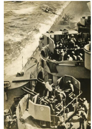
沖縄戦でアメリカ戦艦「ミズーリ」に超低空で特攻突入する瞬間の零戦＝1945（昭和20）年4月11日