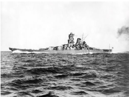
高知・宿毛湾沖を最大速力27ノットで航走する戦艦「大和」＝1941（昭和16）年10月30日撮影