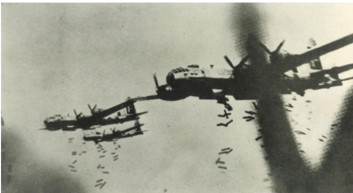
横浜を大空襲するボーイング B-29 爆撃機＝1945（昭和20）年5月29日