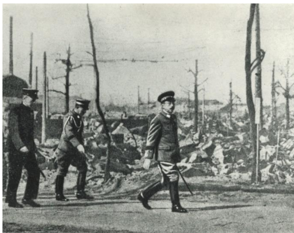
焼野原となった東京大空襲の被災地を視察する昭和天皇=1945（昭和20）年3月18日撮影